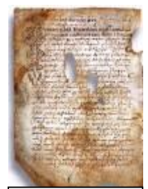
Псковская судная грамота

Двинская уставная грамота 1397 года. Мздоимство упоминается в русских летописях XIV века, например в Двинской уставной грамоте 1397 года в статье 6: «А самосуда четыре рубли, а самосуд то: кто изыснав татя с поличным, да отпустит, а себе посул возьмет, а наместники доведаются по заповеди, ино то самосуд, а опричь того самосуда нет». Там же, в статье 8: «...а черес поруку не ковати, а посула в железех не просити; а что в железех посул, то не в посул».