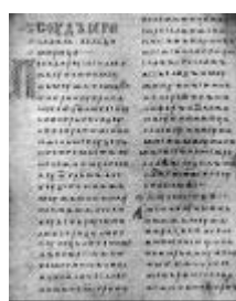
Двинская уставная грамота

Лихоимец – жадный вымогатель, взяточник».